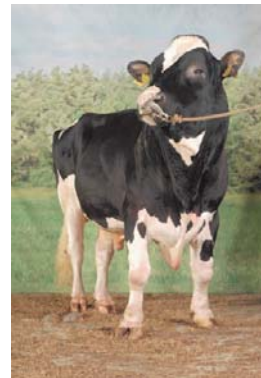
Delta Olympic heeft geen goede klauwverdeling.

Stieren die ronde en geloten klauwen geven, zijn bijvoorbeeld Kian (aAa: 156432), Paramount (aAa: 651423) en Maniac van de Peul (aAa: 516432). De analist waarschuwt echter dat de verschillende kwaliteiten van het aAa-systeem niet op zichzelf staan. „Het gaat om de relaties en invloeden die alle onderdelen op elkaar hebben.” Zo zorgt kwaliteit 4 ‘strong’ voor ruimte voor hart en longen en daarmee voor een betere doorbloeding, dus ook van de klauw. „Een stier als O Man (aAa: 435216, red.) geeft daardoor ook bredere en rondere klauwen”, stelt de analist. „Bij onder andere klauwproblemen is het belangrijk jezelf altijd de vraag te stellen welke constructiefout in het skelet er aan ten grondslag ligt.” ■