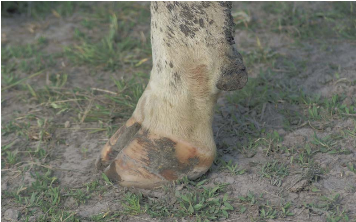
Stevige koten en ronde, brede en goed gesloten klauwen.

'Er is een wereld te winnen wat betreft het lopen van koeien'