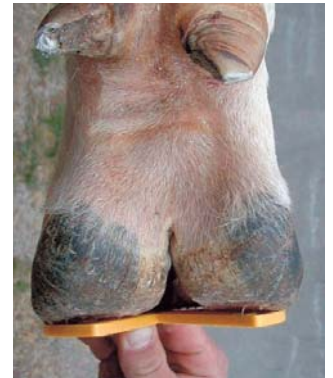
Een ongelijke klauwverdeling.