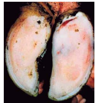
De buitenklauw is groter dan de binnenklauw. De grootste belasting komt op het balgebied van de buitenklauw.